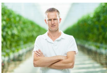
André van Winden Paprikateler rood